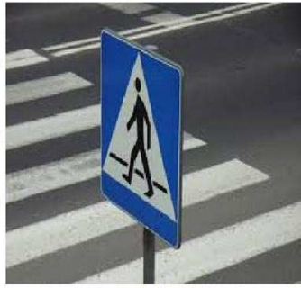
Gleichgemacht zu Boden!!!