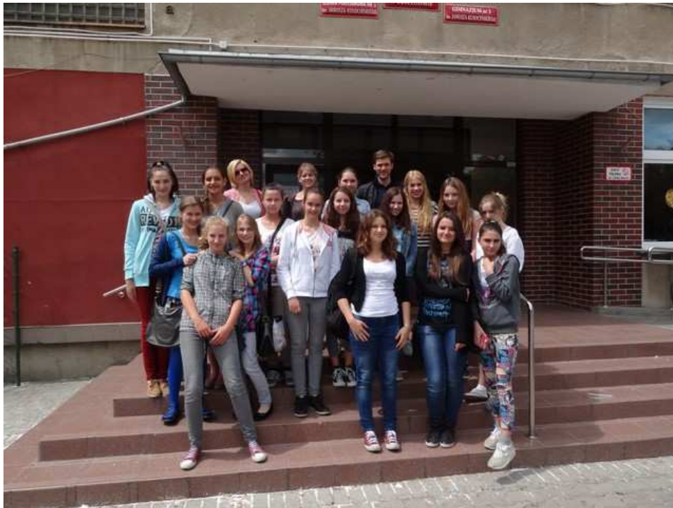
7. Zwiedzanie Sulechowa.