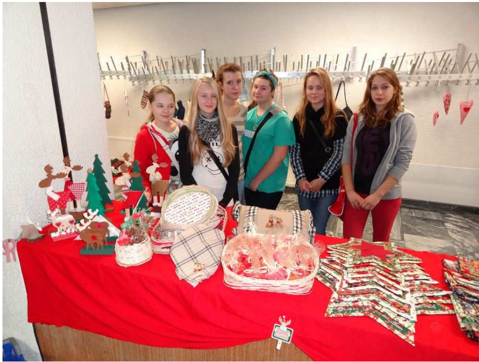
5. Podczas Dnia Otwartych Drzwi w niemieckiej szkole.