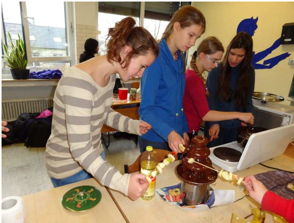
7. W pracowni biologiczno-chemicznej.