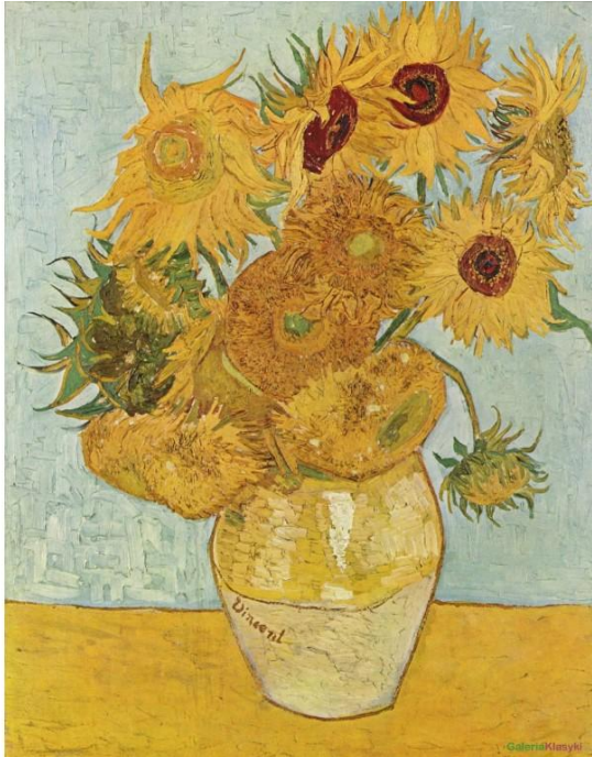
Vincent van Gogh, Słoneczniki, 1888