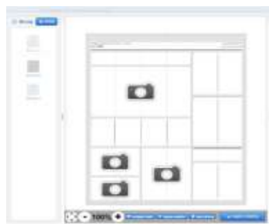
Rysunek 3. Przykładowa makieta