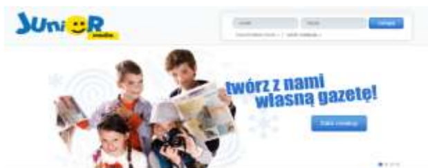
Rysunek 1. Rejestracja