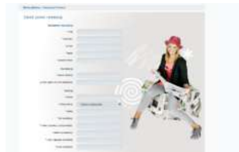
Rysunek 2. Zakładanie konta

Szczegółowa instrukcja rejestracji szkoły w programie: Jak założyć i aktywować redakcję?