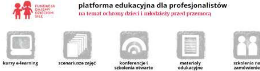
Rys. 1. FDDS - zasoby platformy.

Ważne! Aby zapisać się na bezpłatne kursy e-learning, należy zarejestrować się i założyć konto. Nauczyciel może dodać uczniów swojej klasy i w panelu administratora monitorować ich pracę.