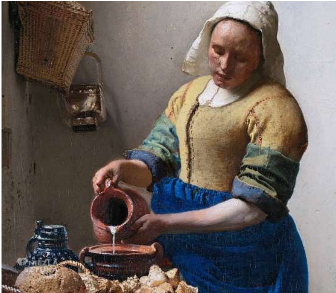
Johannes Vermeer, Mleczarka, detal | 1658-1661, Rijksmuseum, Amsterdam