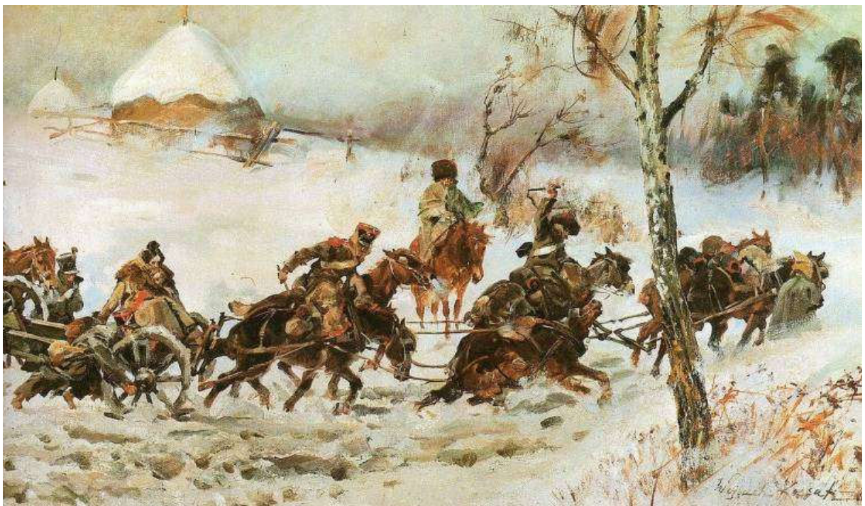
Artyleria w odwrocie, szkic do panoramy Berezyna, 1896 - Wojciech Kossak