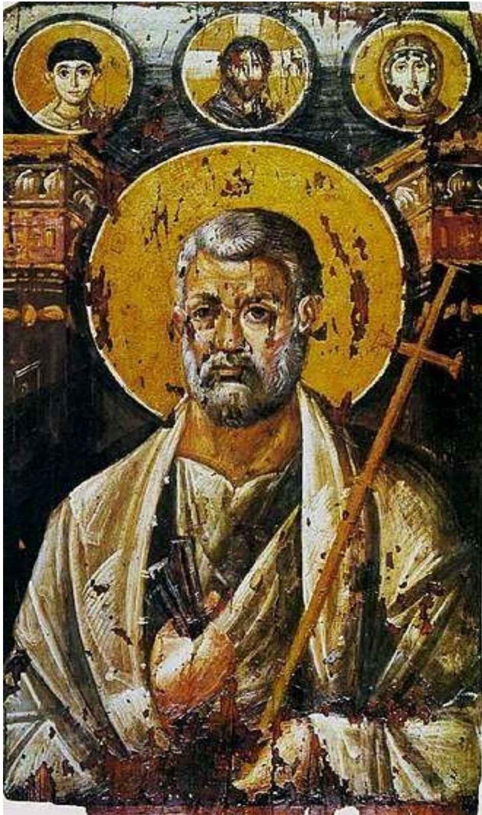
6th-century encaustic icon from Saint Catherine's Monastery, Egypt.