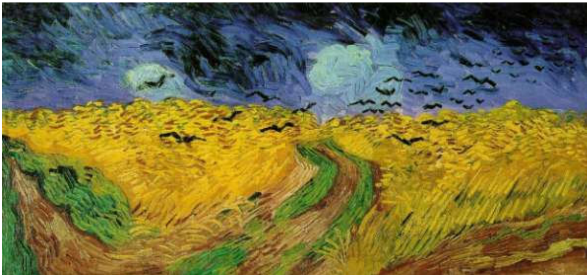
Vincent van Gogh, „Kruki nad łanem pszenicy”, 1890, Muzeum Van Gogha, Amsterdam, Holandia