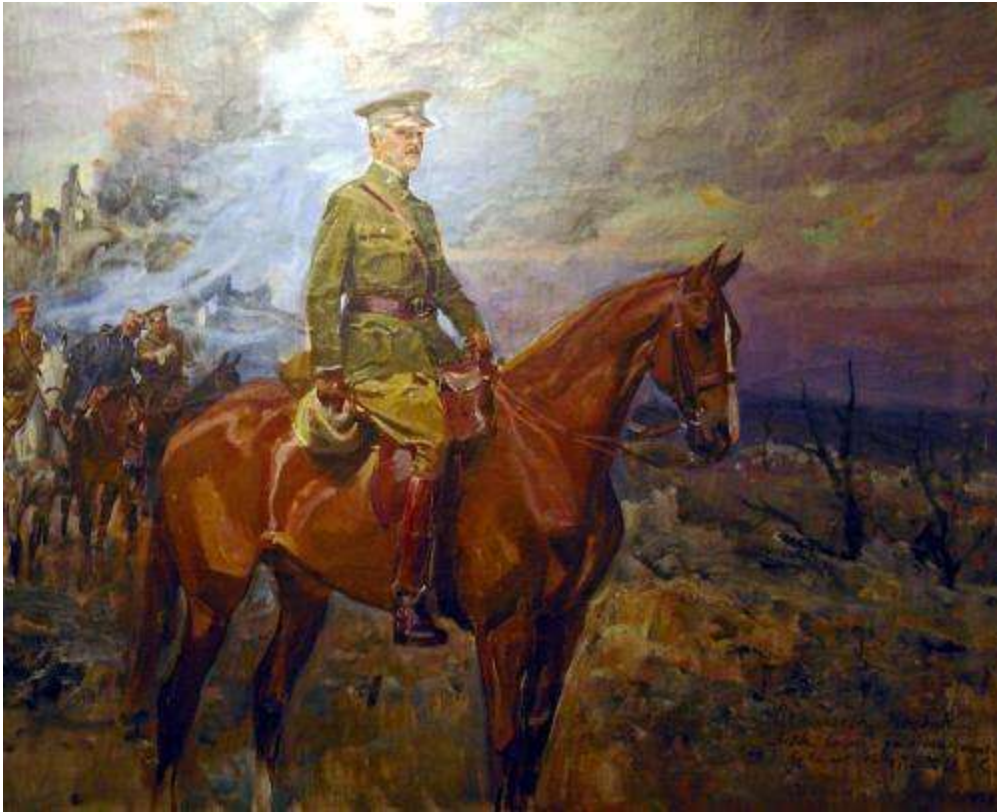
PORTRET KONNY – WOJCIECH KOSSAK (1922)