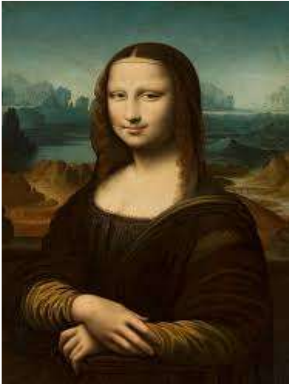
MONA LISA – LEONARDO DA VINCI (1503–1507)