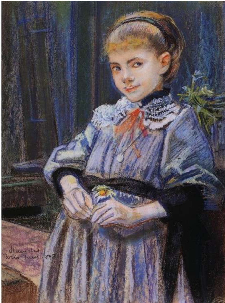
PORTRET DZIEWCZYNI – STANISŁAW WYSPIAŃSKI (1893)