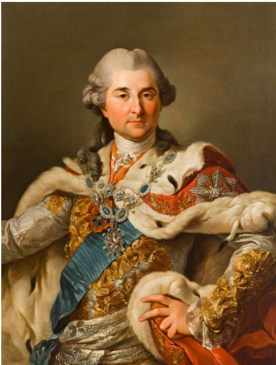
PORTRET STANISŁAWA AUGUSTA – MARCELLO BACCIARELLI I WARSZTAT