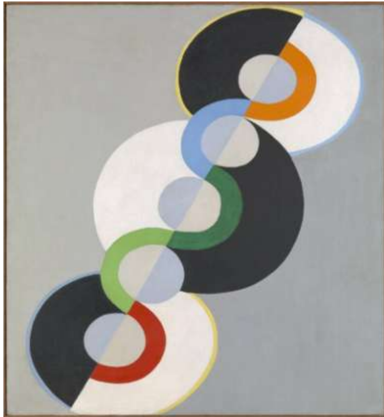
Robert Delaunay, „Nieskończony Rytm”, 1934, Tate Modern, Londyn, Wielka Brtania