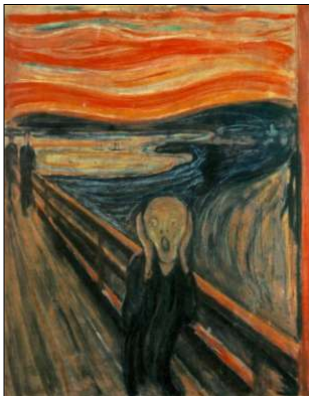
Edvard Munch, „Krzyk”, 1893, Narodowe Muzeum Sztuki, Architektury i Projektowania, Oslo, Norwegia, wikipedia.org, CC by 3.0