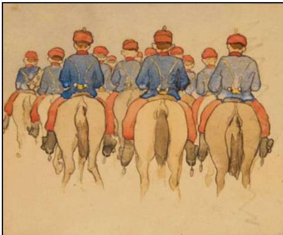
Artur Grottger, „Escadron Schritt”, 1856, Muzeum Sztuki, Łódź, Polska, zasoby.msl.org.pl , CC BY 3.0