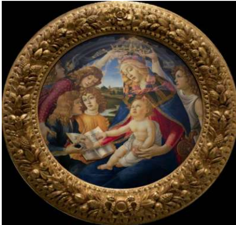
Sandro Botticelli, „Madonna Magnificat”, 1483-1485, Galeria Uffizi, Florencja, Włochy