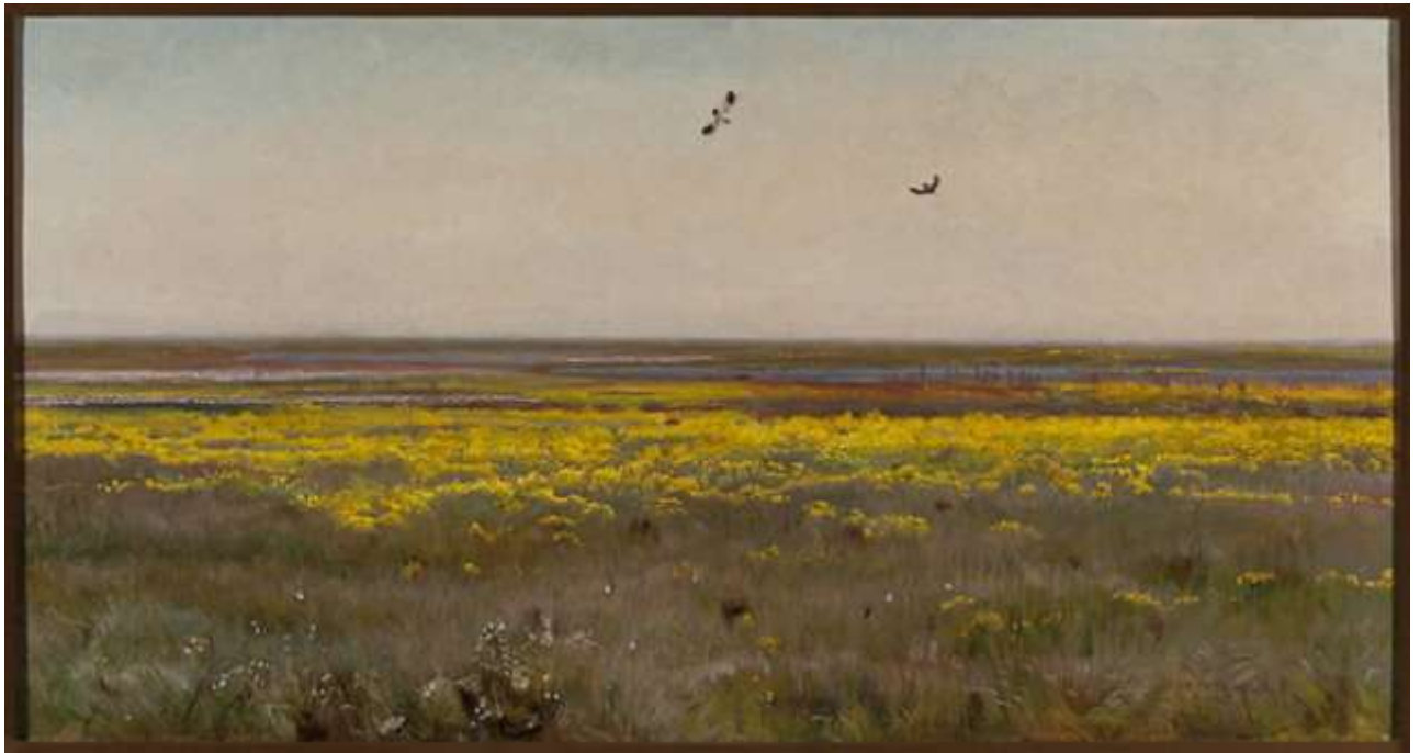
Józef Chełmoński, „Kaczeńce; Wiosna”, 1908, Muzeum Narodowe, Warszawa, Polska, cyfrowe.mnw.art.pl, CC BY 3.0