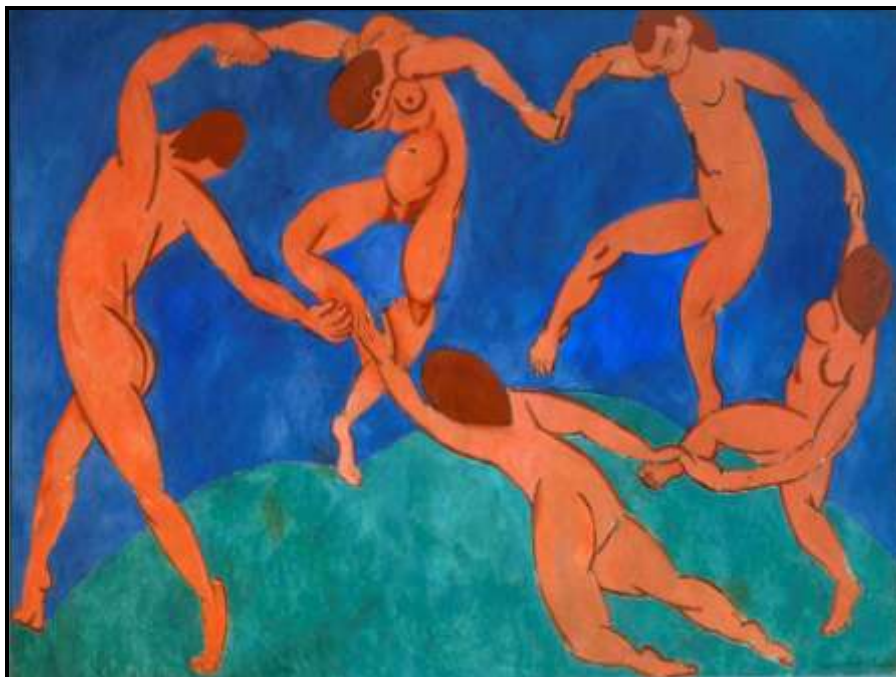
Henri Matisse, Taniec