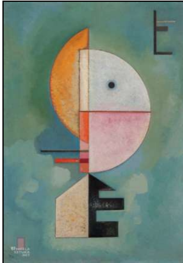
Wassily Kandinsky, Do góry