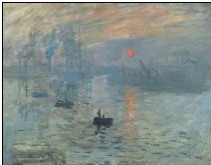
Claude Monet, Impresja, wschód słońca