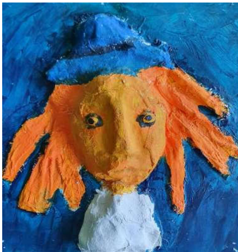
Prace uczniów PSP 7 w Zielonej Górze