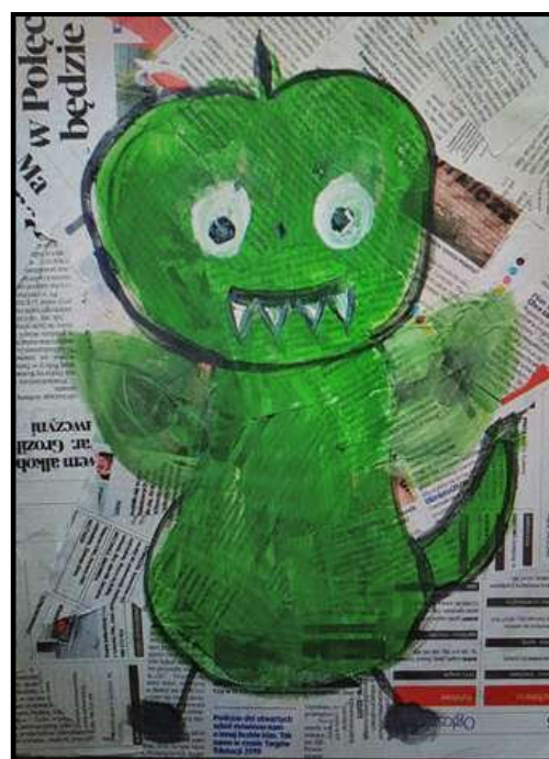
Prace wykonane przez uczniów PSP 7 w Zielonej Górze

Opracowanie: Katarzyna Lasik – doradca metodyczny