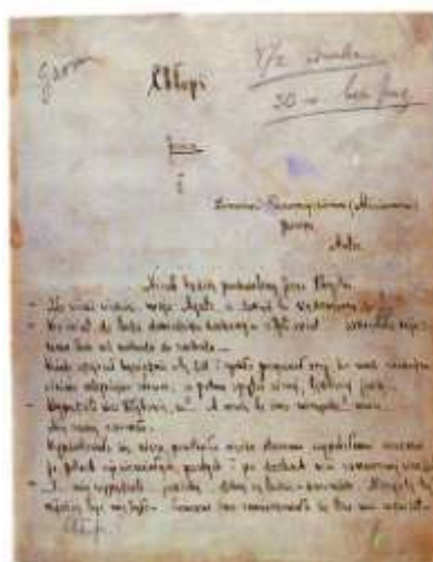
Pierwsza strona rękopisu „Chłopów” Władysława Reymonta