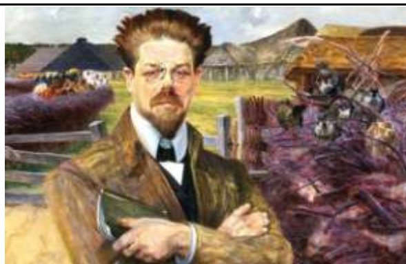
Władysław Reymont na obrazie Jacka Malczewskiego z 1905 roku